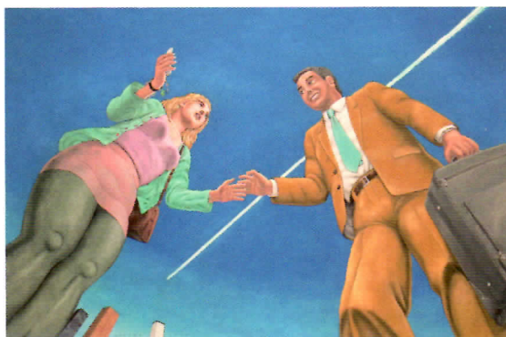
「お帰りなさい」キャンバスに油彩 96.5×147cm 2006