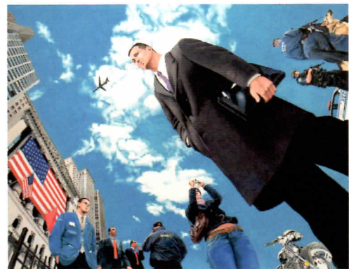
「神はアメリカを祝福する」キャンバスに油彩 127×162.5cm 2007