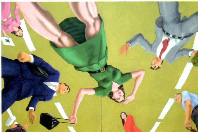
「めまい」キャンバスに油彩 162×130cm×2 1987