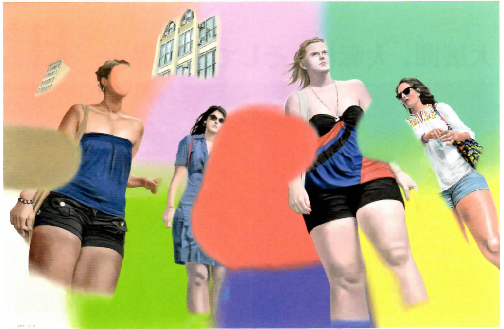
「ブロードウェイ・ウキウキ」キャンバスに油彩 127×96.5cm×2 2010